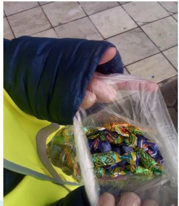
Акция «Поменяй сигаретку на конфетку»