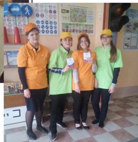
Обучение в «Анти-СПИД»