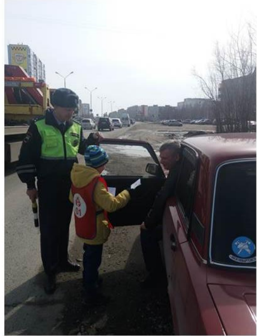
Акция «Соблюдай ПДД»