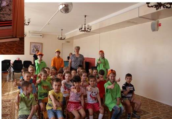
Волонтеры в детском саду «Слоненок»