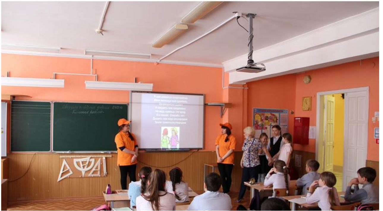
Творческая группа волонтеров Занятие по теме «Как избежать конфликта»