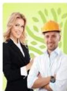
Сотрудник организации-партнера Экодиктанта

Категории отличаются по сложности вопросов: от низкой (для подростков 12-17 лет) до высокой (для экспертов, студентов, специалистов, руководителей в экологической сфере).