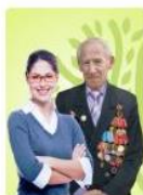
Без профильного образования возраст старше 18 лет