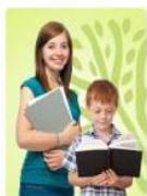
Подростки 12-17 лет