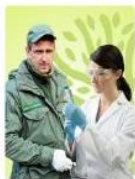
Эксперт, студент, специалист, руководитель в экологической сфере